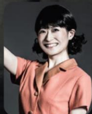
唯月ふうか 小田切とよ 役(鹿賀出演回) 渡辺一枝 役(市村出演回)