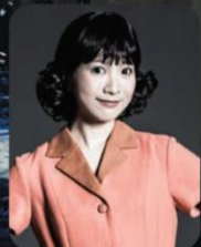
May'n 小田切とよ 役(市村出演回) 渡辺一枝 役(鹿賀出演回)